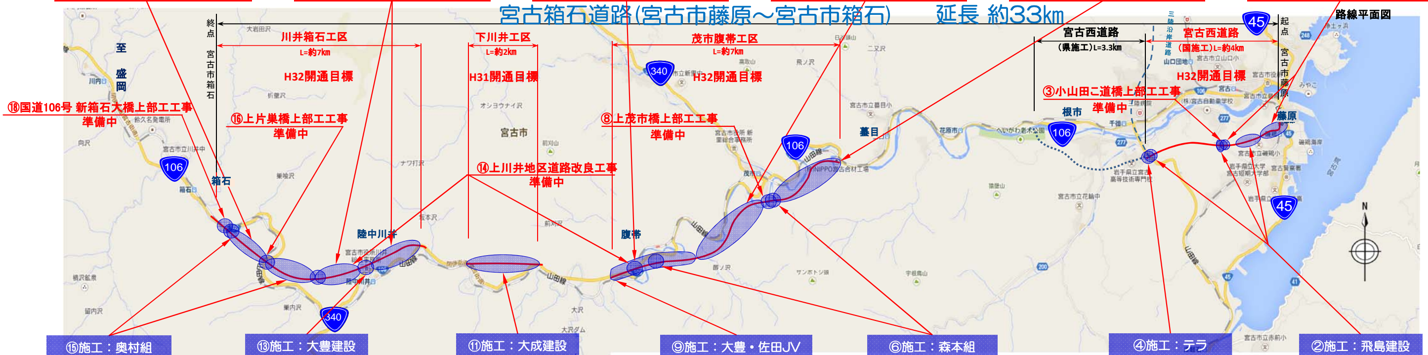
⑱国道106号 新箱石大橋上部工工事 準備中