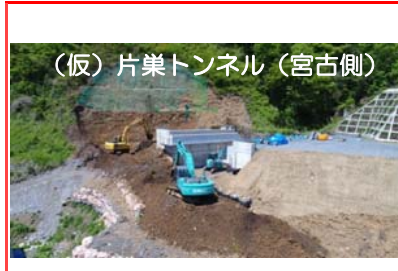
(仮)片巢トンネル(宮古側)