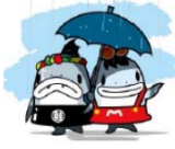
サーモンくん みやこちゃん